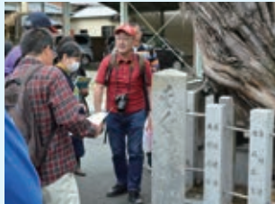
斑鳩町でのボランティアガイド