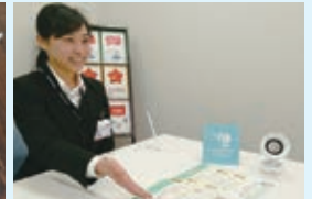
窓口利用イメージ