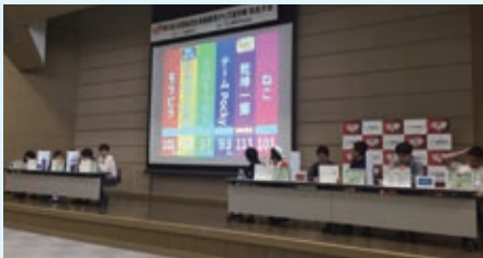
エコノミクス甲子園奈良大会

当行は、地元中学校等への講師派遣や銀行見学・実習生の受入れ、「全国高校生金融経済クイズ選手権「エコノミクス甲子園」」奈良大会、親子金融セミナーの開催など、地元における金融経済教育に積極的に取組んでいます。