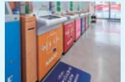
車いすでもご利用いただきやすいATM