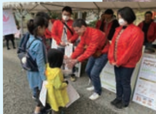
イベント時の募金活動