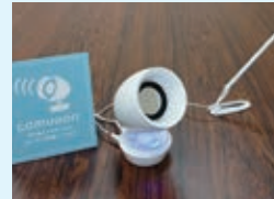
専用スピーカーとマイク