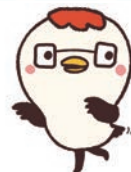
ほけんの窓口 マスコットキャラクター 「イトコドリ」