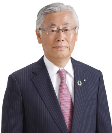
株式会社南都銀行 取締役頭取