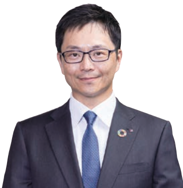
株式会社南都銀行 取締役頭取