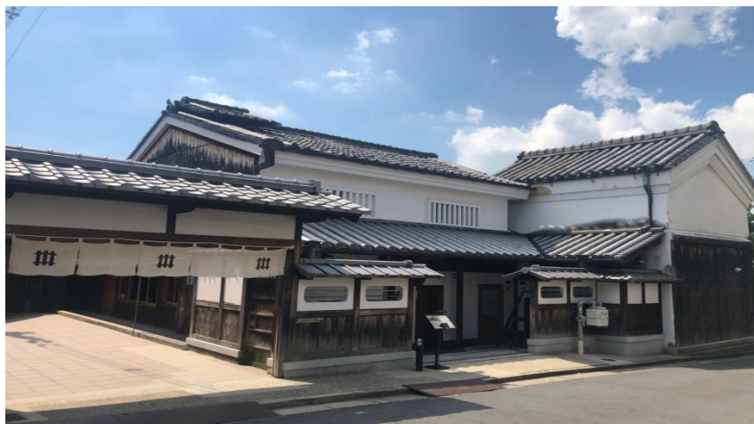
奈良市西城戸町「NIPPONIA HOTEL 奈良 ならまち」

NKMPは、奈良県内の古民家の再生活用により宿泊業や飲食業などを営む観光事業者（以下、「古民家再生事業者」）向けに、劣後社債や優先株を引き受けることでリノベーションや設備導入などに必要な事業資金を提供します。併せて、奈良県内の自治体や地元関係者と連携して、事業計画や資金計画の立案、各種申請手続きの支援といった事業化や事業運営に資するコンサルタント機能を提供します。南都銀行、NOTE、SMFLMPのスポンサー3社それぞれが有する幅広い知見・ノウハウおよびネットワークを駆使し、古民家再生事業者を資金面や経営面でサポートすることで、奈良県の古民家をはじめとする歴史的建築物を利活用したまちづくりを支援してまいります。